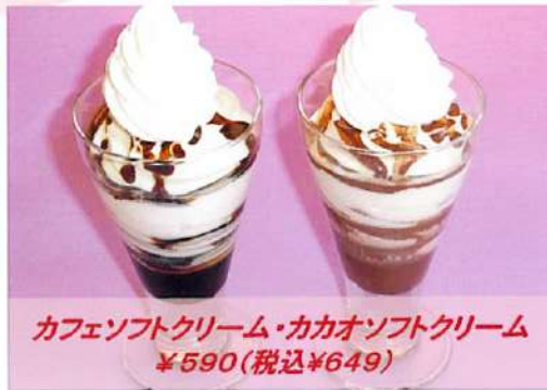
カフェソフトクリーム・カカオソフトクリーム ¥590(税込¥649)