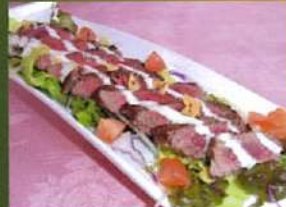
牛ヒレステーキサラダ ¥1,050(税込¥1,155)