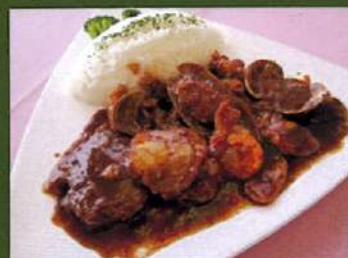
コスモポリタン (ハンバーグ・シーフード チキンソテー入り) ¥980(税込¥1,078)