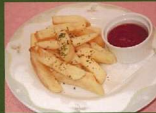
フライドポテト ¥390(税込¥429)