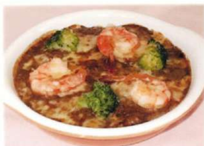
海老カレードリア ¥1,180(税込¥1,298)