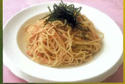
たらこスパゲティ ¥860(税込¥946)