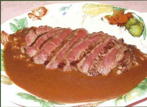
道産牛ヒレステーキカレー ¥1,650(税込¥1,815)