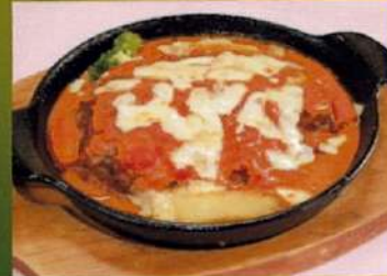
アメリカヌソースの チーズ焼きハンバーグ ¥890(税込¥979)