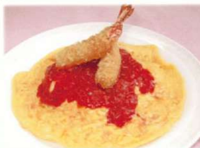
エビフライトマトソース オムライス ¥1,180(税込¥1,298)