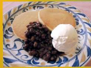
ホットケーキ 小倉ソフト ¥660(税込¥726)