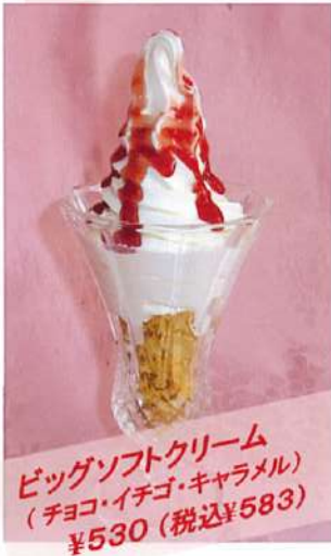
ビッグソフトクリーム (チョコ・イチゴ・キャラメル) ¥530(税込¥583)