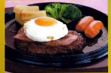
ベーコンエッグ添え 和風ソースハンバーグ ¥890(税込¥979)