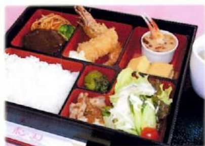
洋風弁当 カップスープ付 ¥1,450(税込¥1,595)

お選びドリンク付き ・コーヒー ・ティー ・ウーロン茶 ・オレンジジュース のいずれか1点