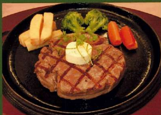
道産牛ヒレグリルステーキ