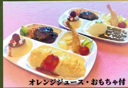
オレンジジュース・おもちゃ付

¥1,450(税込¥1,595) ハンバーグ・チキンソテー・フライ 鴨サラダ・かにグラタン ライス付