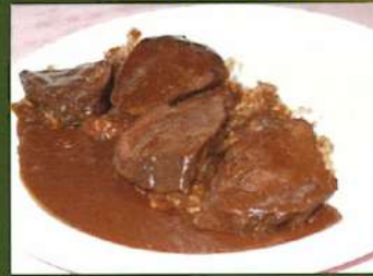
牛タンカレー ¥1,000(税込¥1,100)