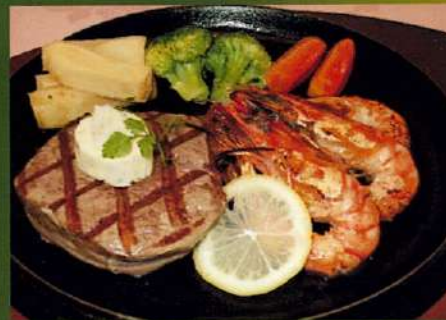
道産牛ヒレと海老の網焼き