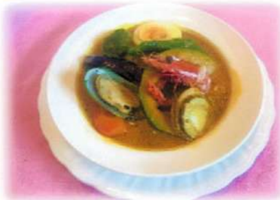
シーフードスープカレー ¥1,380(税込¥1,518)