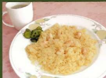
海の幸ピラフカップスープ付 ¥860(税込¥946)