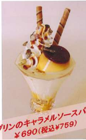
プリンのキャラメルソースパフェ ¥690(税込¥759)