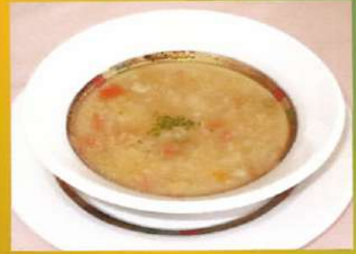
本日のスープ ¥450(税込¥495)