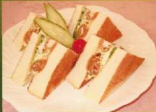
海老フライ ホットサンド ¥660(税込¥726)