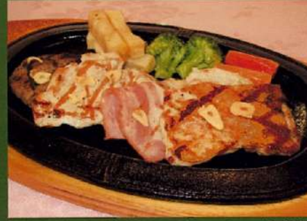
ミックスグリルガーリック風味