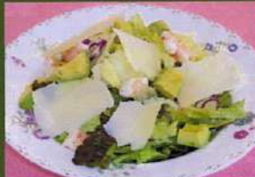
アボカドと海老の シーザーサラダ ¥630(税込¥693)