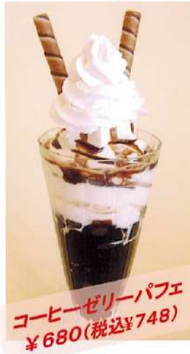
コーヒーゼリーパフェ ¥680(税込¥748)