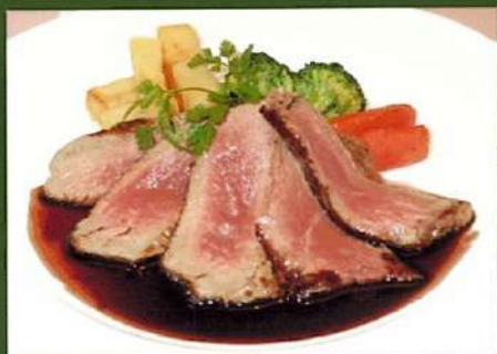
道産牛ヒレのポワレ ¥2,750