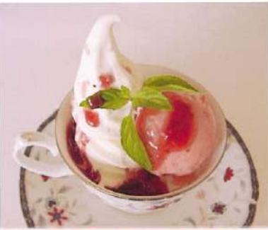
ソフトと苺シャーベット ¥600(税込¥660)