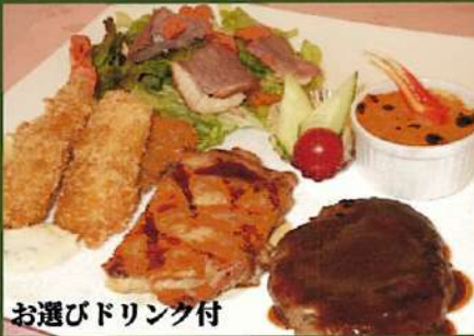
お選びドリンク付