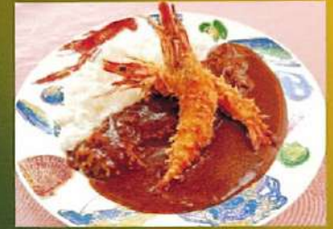
エビフライカレー ¥950(税込¥1,045)