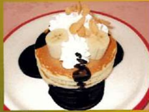
ホットケーキ バナナ ¥600(税込¥660)