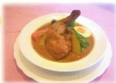
チキンスープカレー ¥1,350(税込¥1,485)