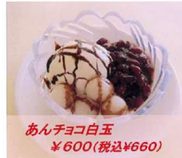
あんチョコ白玉 ¥600(税込¥660)

いちごシャーベット ¥530(税込¥583) コーヒーゼリー ¥530(税込¥583)