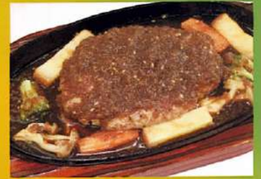
ガーリックソース ハンバーグ ¥890(税込¥979)