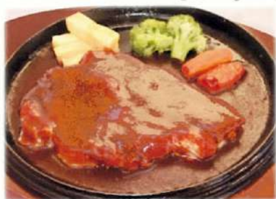
ポークチャップ (200g) ライス付 ¥1,450(税込¥1,595)