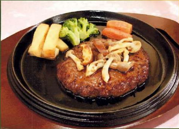
ハンバーグ和風きのこソース ¥840(税込¥924) デミグラスソース ¥840(税込¥924)