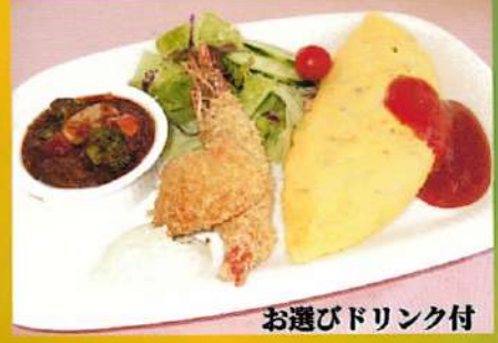
お選びドリンク付