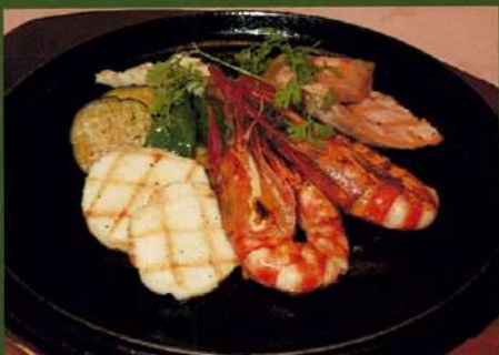
シーフードグリル温野菜添え