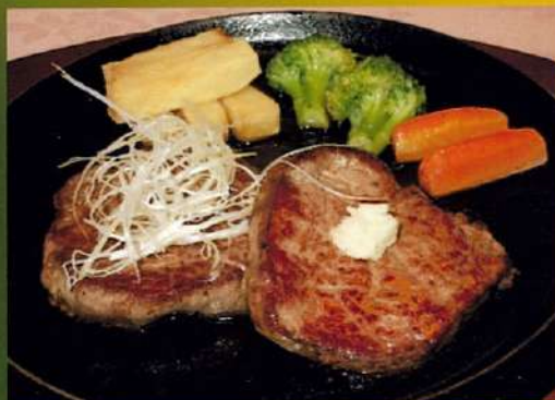
道産牛ヒレステーキ ポン・ヌフ風