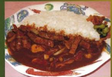
道産牛ヒレ肉の ハッシュドビーフ ¥1,380(税込¥1,518)