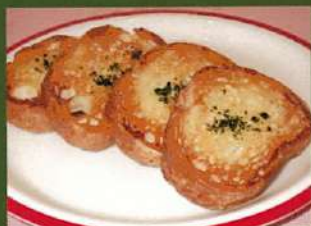
ガーリックトースト ¥390(税込¥429)