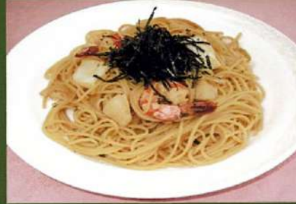
シーフード和風スパゲティ ¥880(税込¥968)