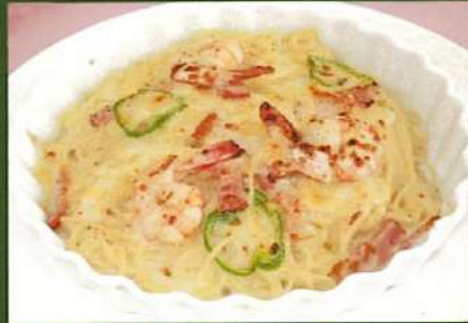
海老入りスパゲティグラタン ¥980(税込¥1078)