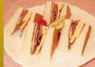
卵とベーコンの ホットサンド ¥630(税込¥693)