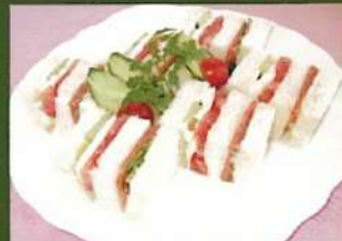
モzzarellaチーズと スモークサーモンの ミックスサンド ¥700(税込¥770)