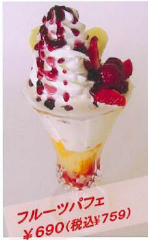
フルーツパフェ ¥690(税込¥759)