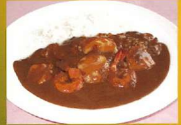
シーフードカレー ¥950(税込¥1,045)