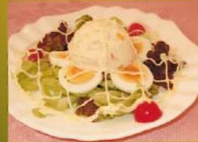
ポテトサラダ ¥580(税込¥638)