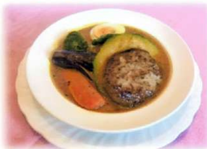
ハンバーグスープカレー ¥1,350(税込¥1,485)