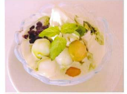
ミルクと抹茶ソースの ソフトクリーム ¥600(税込¥660)