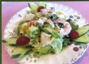
シーフードサラダ ¥680(税込¥748)