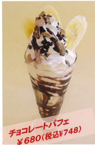
チョコレートパフェ ¥680(税込¥748)