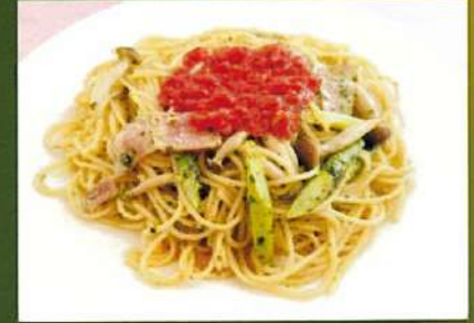
キノコとベーコンの ジェノベーゼスパゲティ ¥880(税込¥968)