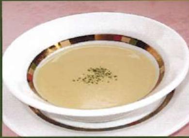
クリームコーンスープ ¥450(税込¥495)