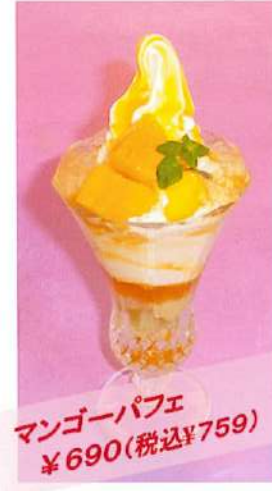
マンゴーパフェ ¥690(税込¥759)