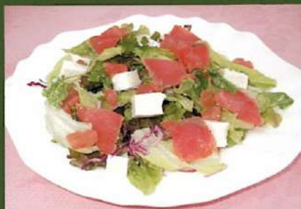
モzzarellaチーズと スモークサーモンのサラダ ¥630(税込¥693)