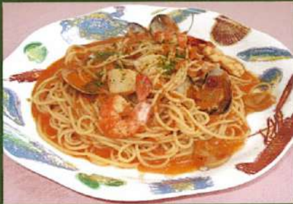
魚介類のパスタ ペスカトーレ ¥900(税込¥990)