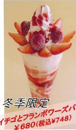
冬季限定 イチゴとフランボワーズパフェ ¥680(税込¥748)