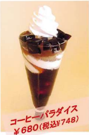
コーヒーパラダイス ¥680(税込¥748)