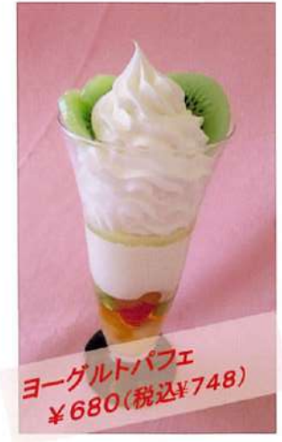
ヨーグルトパフェ ¥680(税込¥748)