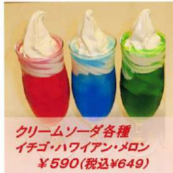
クリームソーダ各種 イチゴ・ハワイアン・メロン ¥590(税込¥649)