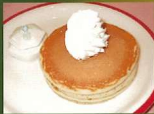
ホットケーキ プレーン ¥500(税込¥550)