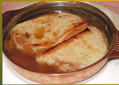
オニオングラタンスープ ¥590(税込¥649)