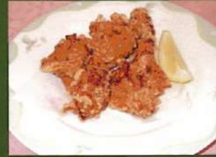
チキンのから揚げ ¥390(税込¥429)