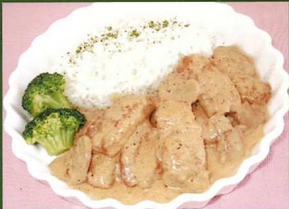
道産牛ヒレのクリームソース煮 ストロガノフ ¥2,100(税込¥2,310)