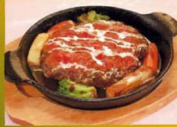
とろけるチーズ包み煮込み ハンバーグ ¥890(税込¥979)