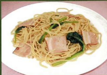
ハウレン草とベーコンの ペペロンチーノ ¥860(税込¥946)