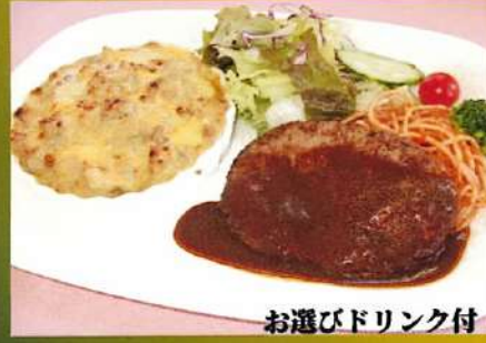
お選びドリンク付