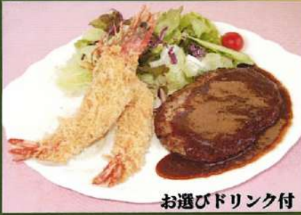
お選びドリンク付